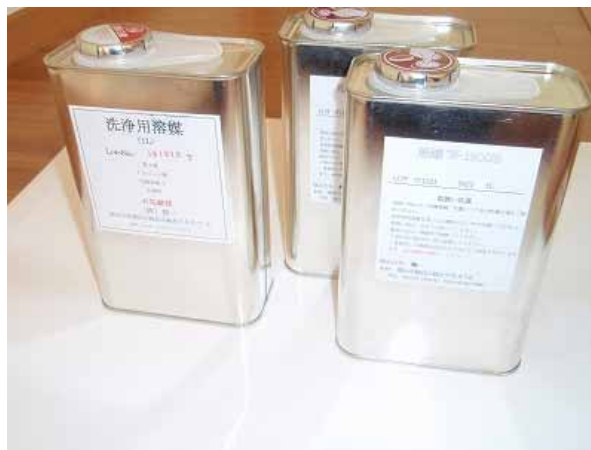
超越液 D&E Type と洗浄液

超越紙 ：天然素材の紙に、無機質のガラス質をコーティングし、紙の性質はそのままにガラスの持つ特性を付与したものが超越紙(R)です。(超越紙(R)は、(株)飾一の登録商標です)