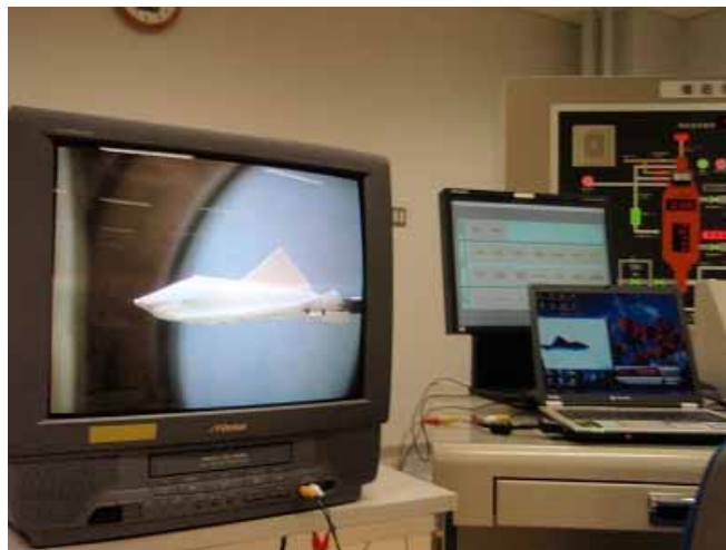
コントロール室のモニター画面, シュリーレン画像で観察可能

六分儀天秤先端のモデル支持方法はM6mm \Phi ピッチ1mmネジによる固定.