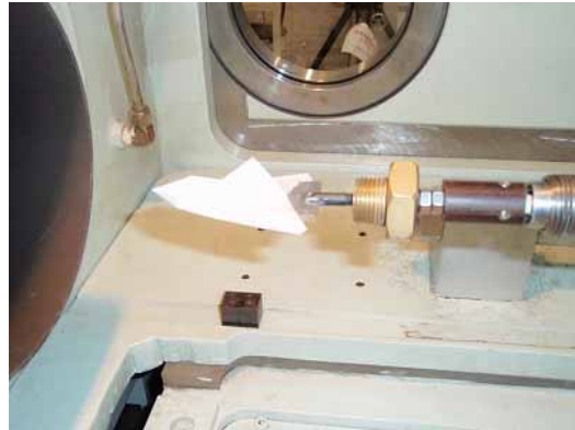
TX-2DB の風洞測定部への取付け状況