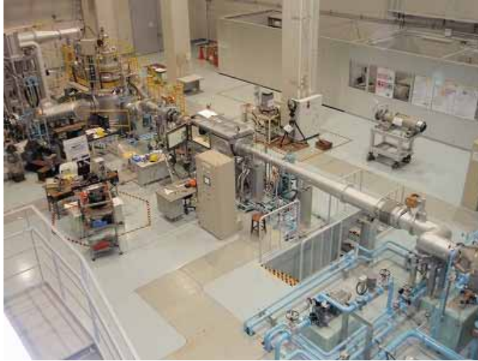
風洞装置の中央測定部

http://daedalus.k.u-tokyo.ac.jp/wt/pamphlet_Jan2007.pdf