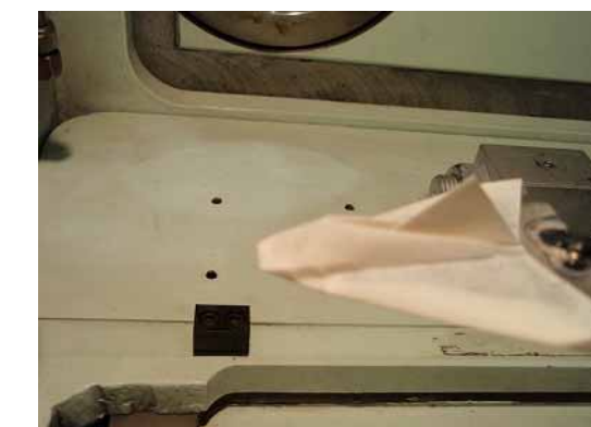
2回目の実験機、TX-3DB 先端鼻下折りタイプ 単純に下側に折って接着