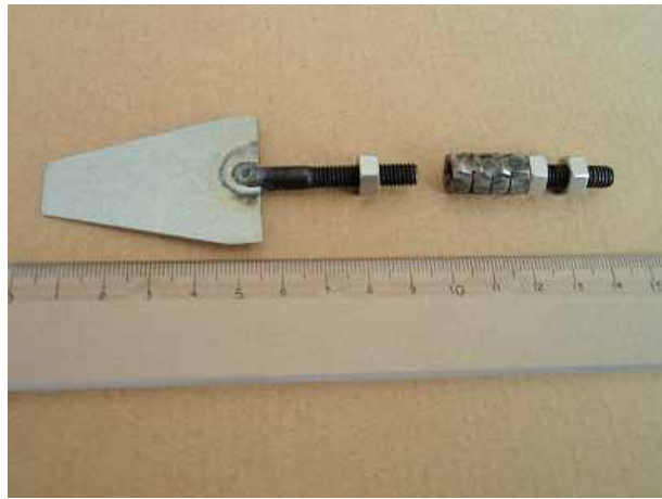
CASTEM 社特製 Holder & Extension