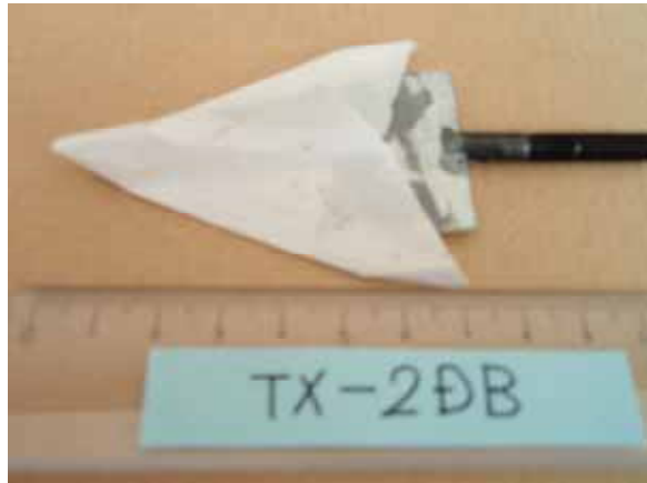
第1回実験に使用した機体 TX-2DB Normal Type 先端鋭角トンガリ型